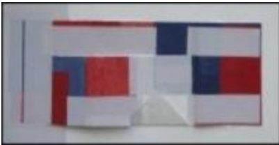
Stephan J. Möller , Komposition, 2013, Papier, Pappe auf Leinen