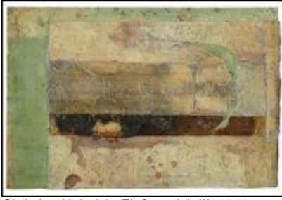
Christian Heinrich , Flußsteppich III, 2013, Öcollage auf Karton, 29 x 42,8 cm