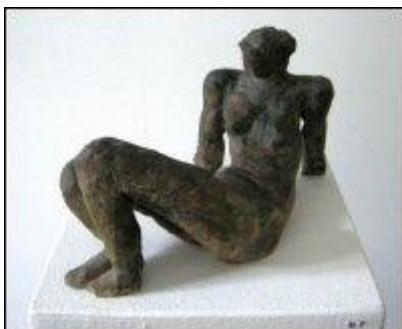
Hans Vent, "Liegende, aufgestützt", 1985, Keramik

Die Vernissage findet am 31.01.2014 um 20.00 Uhr statt.