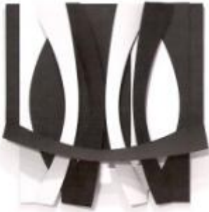
Gisela von Bruchhausen, Quintett, 2011, Stahl, verzinkt, bemalt