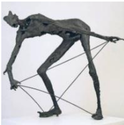
Germaine Richiers, "Das Krallenwesen", 1952, Skulptur