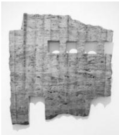
H. M. Franke, "relief", 2012, Muschelkalk

Aus: "Wir sind Sandkörner im Getriebe", Interview im Tagesspiegel vom 29.3.2012